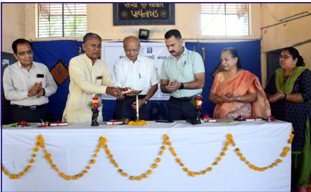
લોકસમન્વિત શિક્ષણ સંવર્ધન યોજના