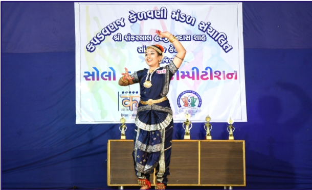
સોલો ડાન્સ કોમ્પિટીશન