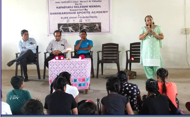
ફેન્સીંગ ટ્રેનીંગ સેન્ટરનું ઉદ્ઘાટન