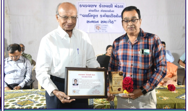
વચનિવૃત્ત કર્મચારીઓનો સન્માન સમારોહ