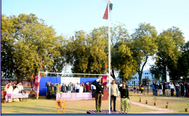
પ્રજાસત્તાક દિનની ઉજવણી