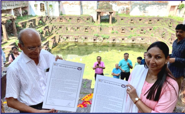
કપડવંજ હેરીટેજ સીટી પ્રોજેક્ટ - MOU