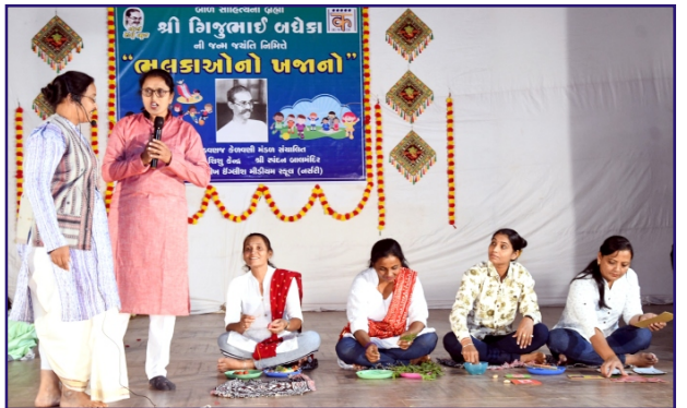
શિક્ષકો દ્વારા બાલવાર્તા - ગીત પ્રદર્શન