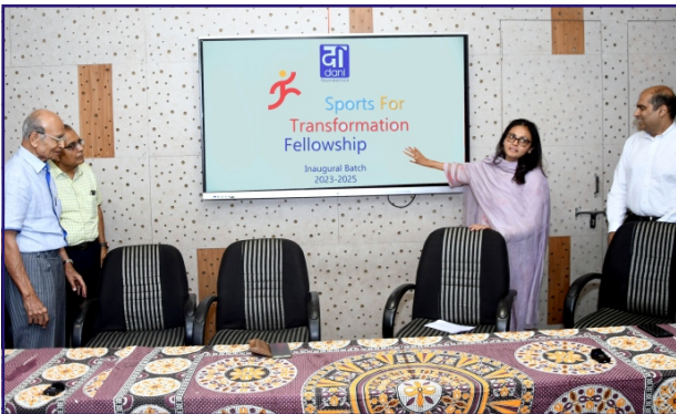
ઈ.એલ.એમ.એસ. ફેલોશીપનું ઉદ્ઘાટન