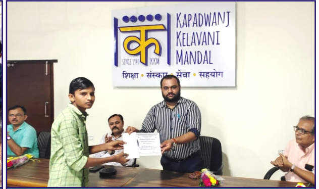
ફોટોગ્રાફી સ્પર્ધા - ૨૦૨૨