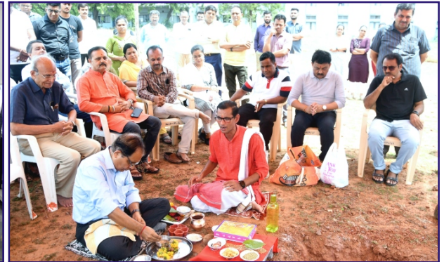
કોલેજ કેમ્પસના મકાનનું ખાત મૂકવું